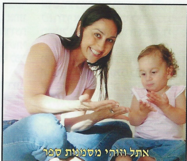
אתל וזוהי מסמנות ספר

מסמנים איתם היא עשירה וצבעונית יותר. עובדה: אנשים זוכרים 20% מהדברים שהם שומעים, 50% מהדברים שהם שומעים ורואים, ו-90% ממה שהם שומעים, רואים ועושים. ילדים החשופים לשפת הסימנים שומעים, רואים ו-“נוגעים” במילים.