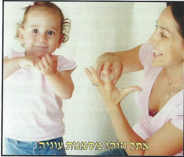
אתל וזוהי מסמנות עוגייה

כבר לא צריך לחכות לגיל שנתיים! פעוטות יכולים לספר לנו מה הם רוצים וחושבים לפני שהם יכולים לדבר!