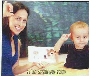
פפה מסמנים פרה